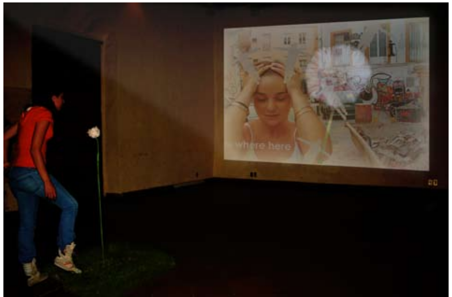
Museo del Estado. Morelia Michoacán Exhibición 28 02 2007

(Constantes/Variables) Son las Historias que Genera el propio Usuario cuyo contenido siempre es Aleatorio, en Tiempo Real y Diferente.